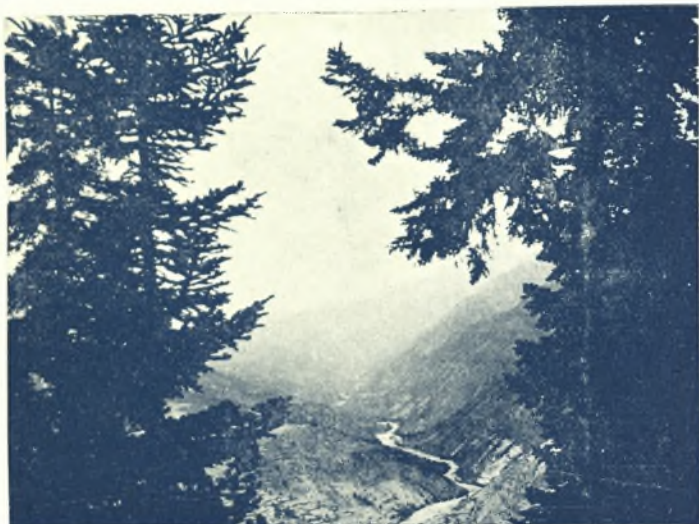
Ὁ Ἄσπροπόταμος διὰ μέσου τῶν ὠραίων Θεσσαλικῶν ὄρεων