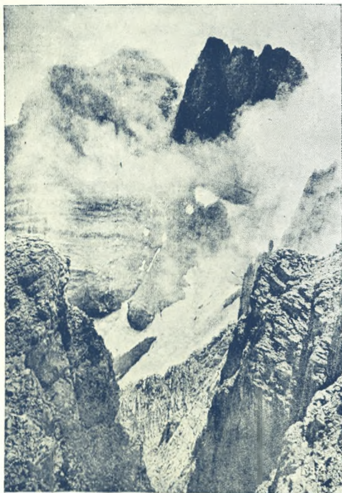
Ὁ μεγαλοπρεπὴς Ὀλυμπος, ἡ κατοικία τῶν ἀρχαίων Θεῶν

τῆς προμνημονευθείσης ὄρεινῆς περιβολῆς, ἡ δὲ ἐκ τῆς ἐν τῷ μέσῳ πεδιάδος, ἥτις ὀνομάζεται κοιλάς τοῦ Πηνειοῦ ποταμοῦ, διότι ὁ ποταμὸς οὗτος διαρρέει αὐτὴν καθ' ὅλον τὸ μῆκος καὶ ὑποδέχεται πάντα τὰ ὕδατα τῆς χώρας.