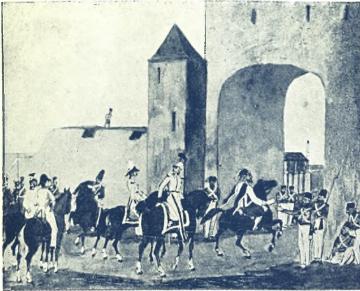
Ἀποστολή Ἑλλήνων Ἀξιωματικῶν εἰς Λάρισα κατὰ τὸ 1836