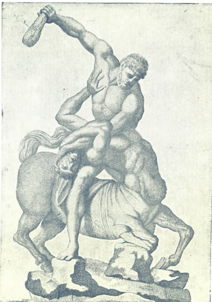
Ἄγρια μάχη τοῦ Βασιλέως Θησέως καὶ τοῦ Κενταύρου