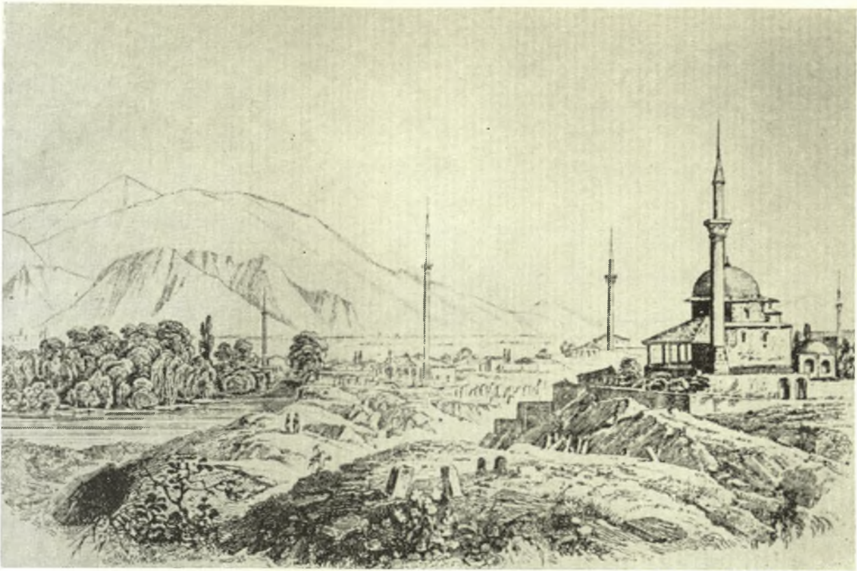
Τὸ ὄρος Ὀλυμπος ὅπως φαίνεται ἀπὸ τῆ Λάρισα (Σχέδιο τῶν ἀρχῶν τοῦ XIX αἰῶνος).

στοὺς πασάδες ἀξιώματα ποὺ ἔρχονταν σὲ μεγάλη ἀντίθεση μὲ τὰ δικαιώματα ποὺ παραχωρήθηκαν στοὺς ἀρματολούς. Οἱ πασάδες γίνονταν συγχρόνως Ντερβεντζημιστῆδες, ὑπεύθυνοι δηλαδή γιὰ τὴ φρούρηση τῶν δρόμων. Γιὰ τὴν ἐπιτήρηση αὐτῶν τῶν δρόμων ἔπρεπε νὰ δημιουργηθοῦν νέες πολιτοφυλακὲς ὑπαγόμενες στὴ δικαιοδοσία τῶν Ντερβεναγάδων. Οἱ συγκρούσεις ἀνάμεσα στὰ τουρκικὰ σώματα καὶ τοὺς ἀρματολούς δὲν ἄρρησαν νὰ ξεσπάσουν.