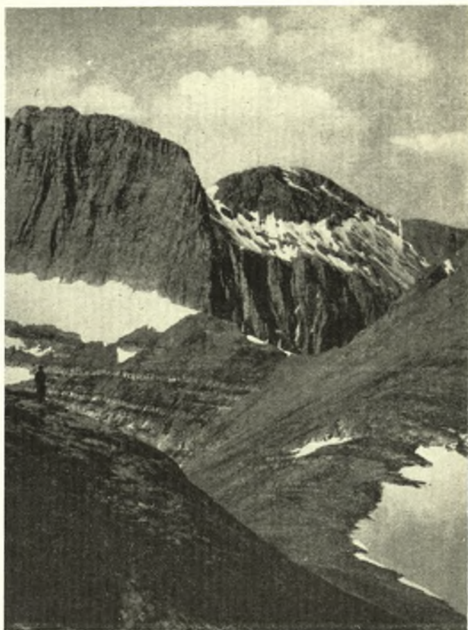
Οἱ ψηλότερες κορφές τοῦ Ὀλύμπου ὅπως φαίνονται ἀπὸ τὸν Προφήτη Ἡλία.

Ἀπὸ αὐτὴ τὴν πεδιάδα, ὅπου σήμερα δὲν ὑπάρχουν παρά τὰ ἔλη τῆς Βοιβηίδος, οἱ πλαγιές τοῦ Ὀλύμπου ὑψώνονται ὀμαλά πρὸς τὸν Βορρᾶ. Τὸ ὄρος ἀπλώνεται δυναμικὰ μὲ ὅλη τὴν ἀπλότητα τῶν γραμμῶν του.