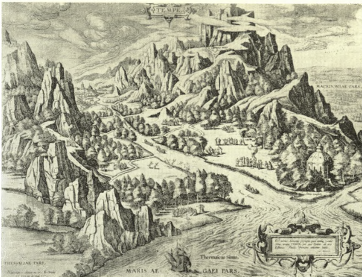
Τό όρος Όλυμπος και ή κοιλάδα τών Τεμπών, όπως φαίνονται από τό Αίγαίο (Σχέδιο του Abraham Ortelius, 1590).

Όταν οί Περραιβοί κτυπήθηκαν από τούς Λαπίθες κι άργότερα από τούς Θεσσαλούς, άποσύρονταν συνεχώς πιό ψηλά στις πτυχές του Όλύμπου και έγκαταστάθηκαν πιθανάτα στα φαράγγια τής Καρυάς και του Σπαρμού, όπου θά πρέπει νά αναζητήσουμε την πόλη τους Δωδώνη. Είηαι ή «ψυχρή Δωδώνη» που ύμνησε ο Όμηρος και που δέν θά πρέπει νά την σχετίσουμε με τό δοξασμένο ίερό τής Ήπείρου.