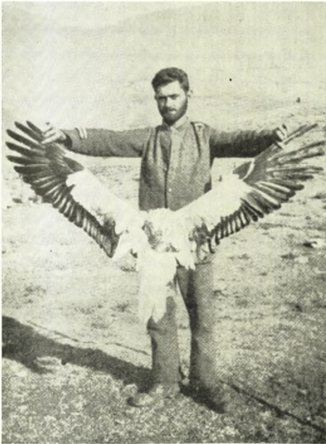
Ο λοχίας συνοδός μας σκότωσε ένα αετό και τον επίδεικνύει για τίς θαυμαστές διαστάσεις του.

Η σύγκρουση έγινε πιθανότατα στα περίχωρα του σημερινού χωριού Άγιος Δημήτριος, μοναδική θέση όπου οί στρατοί μπορούσαν να κινηθούν εύκολα. Ο βράχος της Πέτρας ήταν άφύλαχος. Οί Ρωμαίοι ξαφνικά κατέλαβαν την πεδιάδα της Κατερίνης και ο Περσεύς, από φόβο μή-