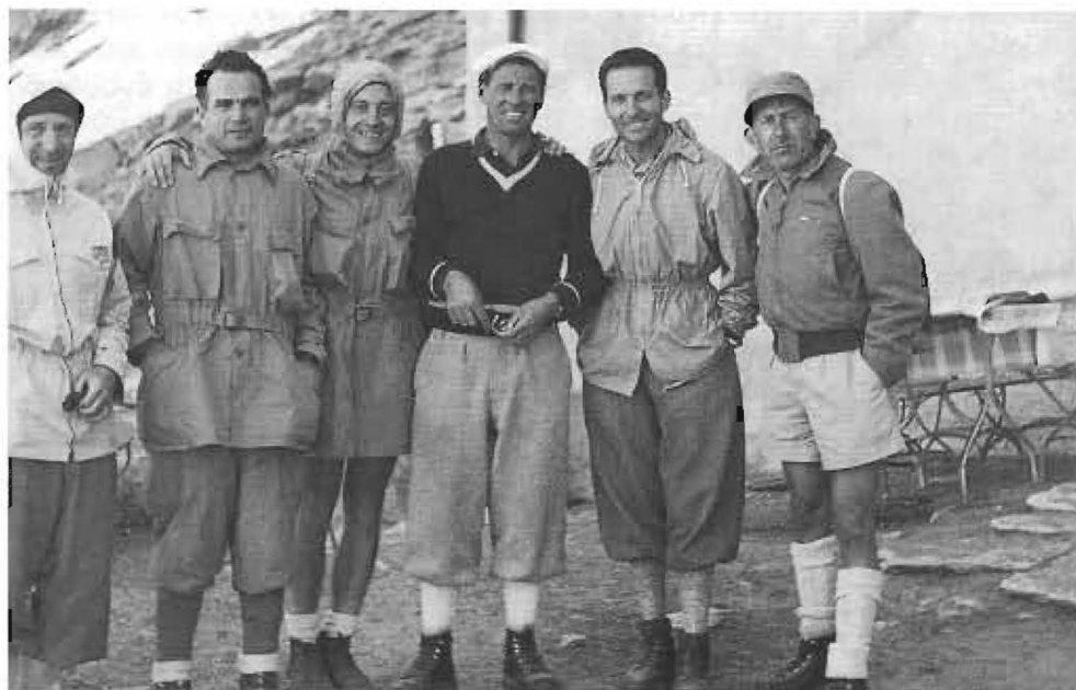
Καταφύγιο Hornli, Matterhorn (1951)