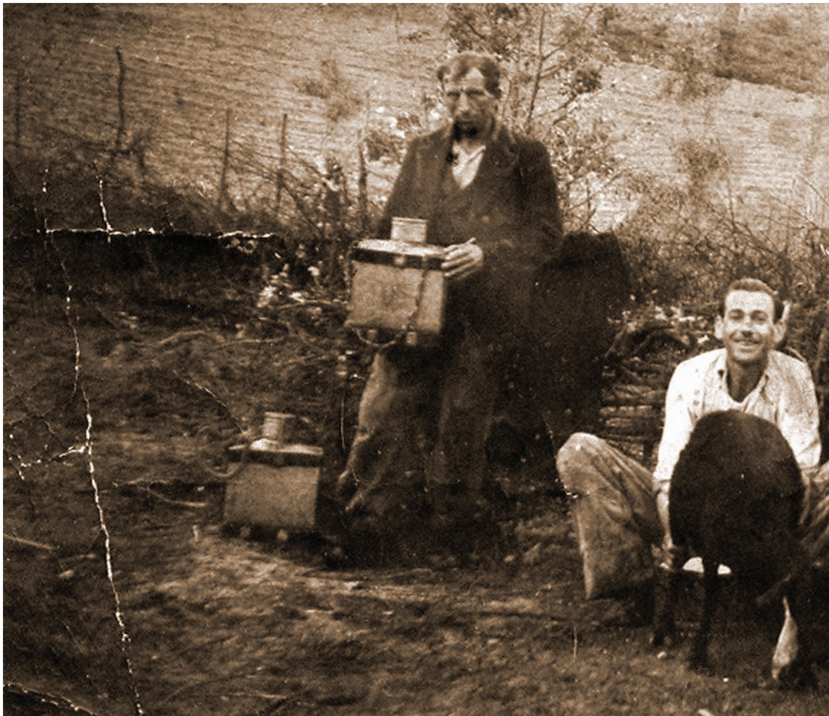
Κτηνοτροφική ζωή (Πυργαετός, «Λάγκα» 1944)