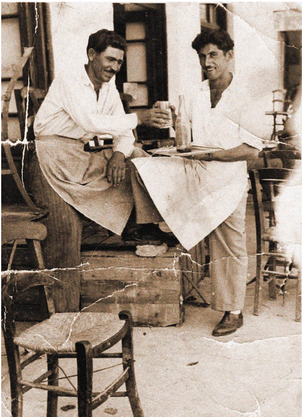
Στο καφενείο του Πυργετού, «Βακούφκο»

Οι δεσμοί των ανθρώπων στη μικρή κοινωνία του χωριού ήταν ισχυροί. Η συντροφικότητα καλλιεργούνταν στο χώρο της εργασίας, αλλά και τις ώρες της σόφλης, όταν αντάμωναν στο καφενείο. Οι άντρες μετά τη δουλειά μαζεύονταν στο καφενείο. Οι διηγήσεις για τα περασμένα ήταν το πιο κοινό θέμα συζήτησης. Οι άντρες έχουν ανάγκη να διηγούνται τις εμπειρίες τους περισσότερο από τις γυναίκες. Οι διηγήσεις σημαντικών γεγονότων επαναλαμβάνονταν μέχρι που γίνονταν κτήμα όλου του χωριού, μύθος και θρύλος και περνούσαν από γενιά σε γενιά. Άλλα θέματα συζήτησης ήταν για τα σπαρτά και τα ζώα. Οι πληροφορίες που αντάλλασσαν ήταν σημαντικές για τη γνώση της αγροτικής ζωής.