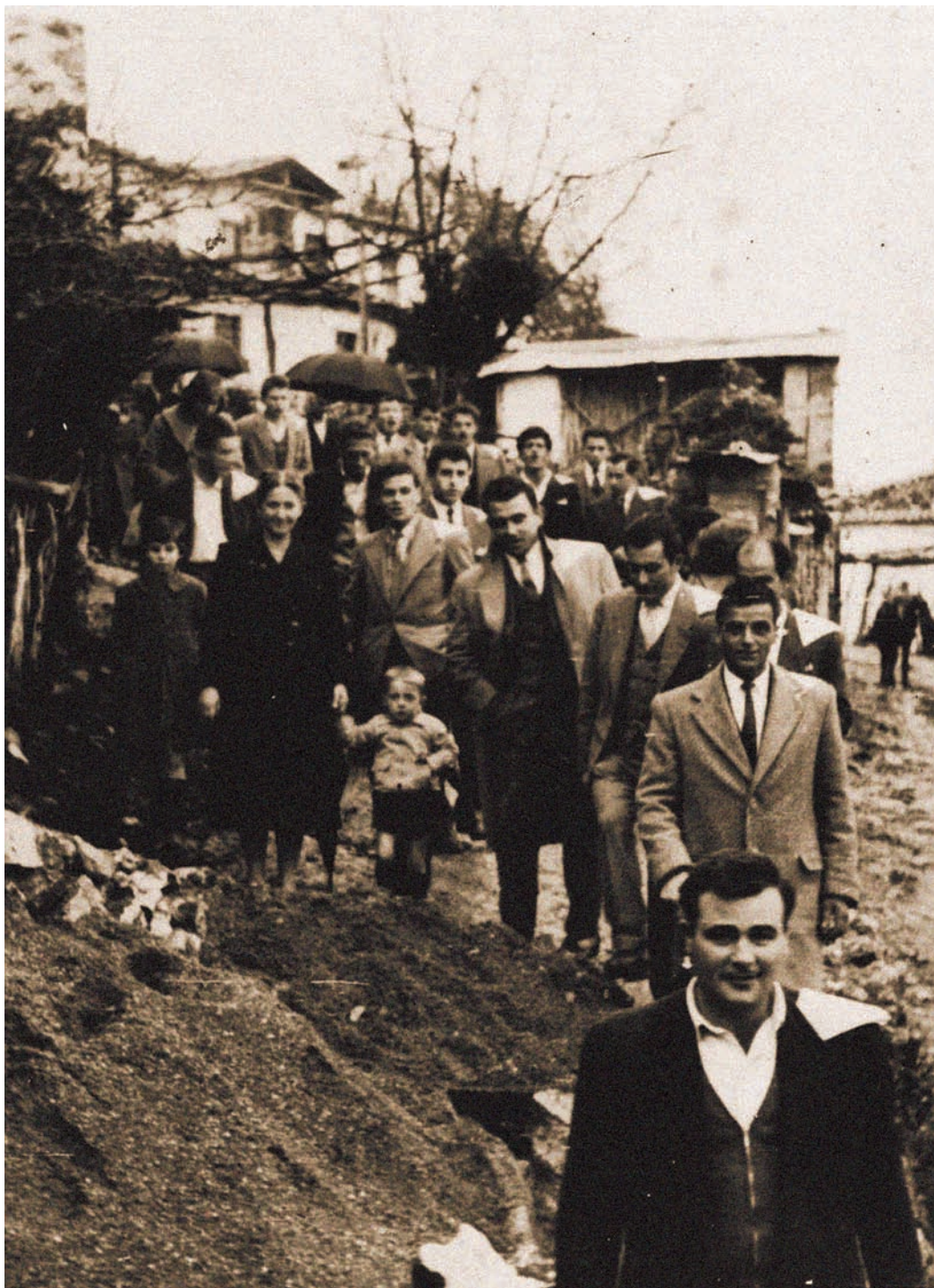
Τα μπρατίμια πηγαίνουν στη νύφη

Όταν τακτοποιούνταν η προίκα, ξεκινούσαν όλοι μαζί, πήγαιναν να πάρουν το νουνό, κι ύστερα πήγαιναν όλοι μαζί στο σπίτι της νύφης. Η νύφη έβγαινε από το σπίτι κλαίγοντας που αποχωρίζεται τους δικούς της.