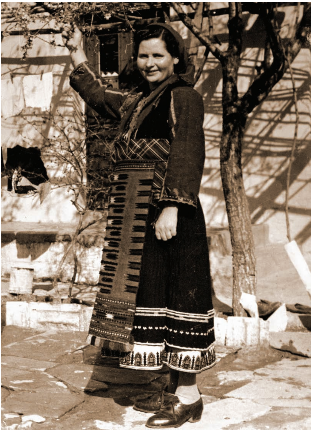
Τοπική φορεσιά της Ραψάνης (Σταμουλιώ Σδούγκα- Γιαννούκα)