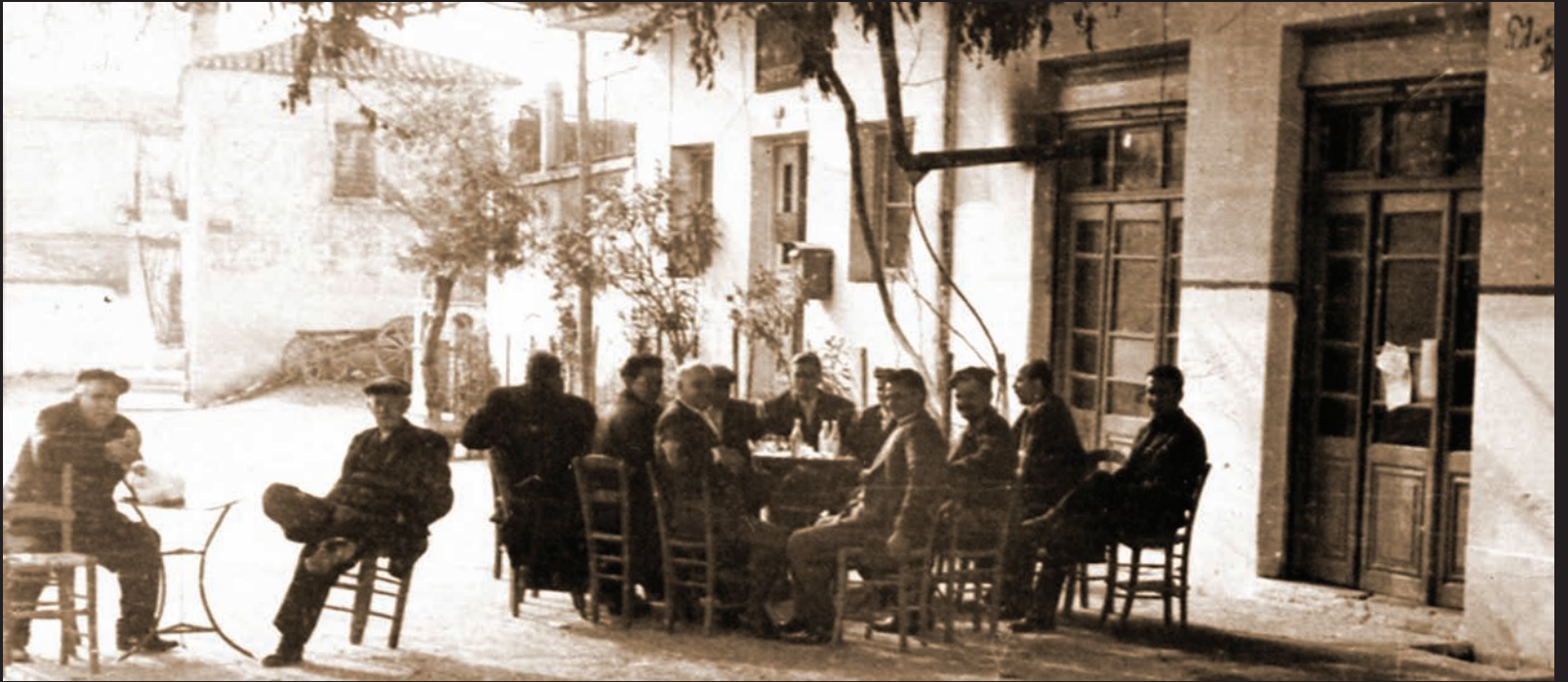
Εξοχικό καφενείο, Αγ. Γεώργιος 1931