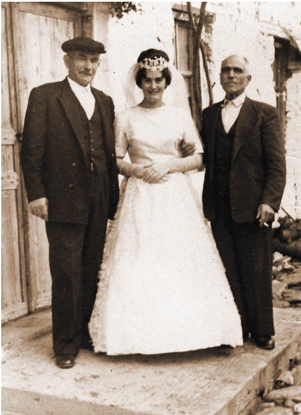
Η νύφη τις τελευταίες στιγμές στο πατρικό της

Τη μέρα του γάμου οι συγγενείς μαζεύονταν στο σπίτι του γαμπρού τον έντυναν, τον στόλιζαν και τον τραγουδούσαν. Ύστερα οι συγγενείς του γαμπρού και τα μπρατίμια πήγαιναν στο σπίτι της νύφης να πάρουν την προίκα. Μπροστά πήγαιναν τα όργανα που έπαιζαν την πατινάδα (τραγούδι που παίζεται μόνο από τα όργανα). Από πίσω τα μπρατίμια χτυπούσαν παλαμάκια. Δυο τρία κρατούσαν μουλάρια, για να κουβαλήσουν τα προικιά. Κάθε μουλάρι είχε στο δεξιό λουρί από το καλινάρι δεμένο ένα άσπρο μαντίλι.