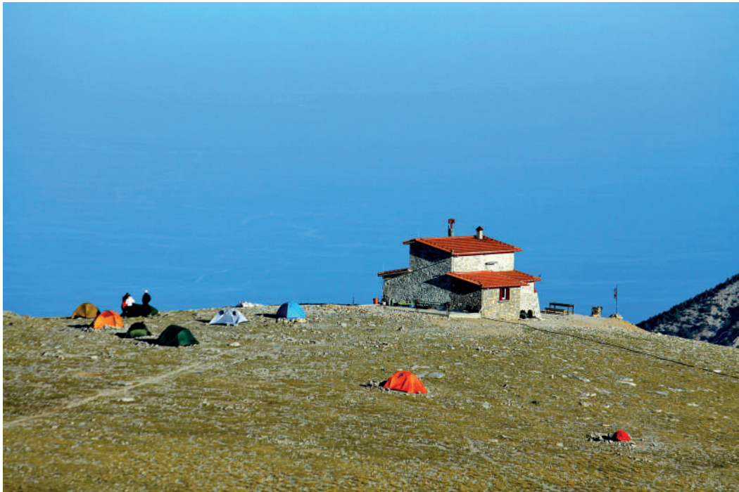
Το καταφύγιο του Κάκκαλου και μερικά από τα αντίσκηνα στην άκρη του Οροπεδίου.

έξω από το κτίριο, στην περίπου επίπεδη ράχη του Οροπεδίου των Μουσών. Πάνω στο χορταριασμένο έδαφος, είναι στημένες πολύχρωμες σκηνούλες. Γερά στερεωμένες όλες, τολμούν με περίσσια αμεριμνησία να ορθώνουν το μικροσκοπικό καμπυλόγραμμο μπόι τους κόντρα στους μανιασμένους βοριάδες του βουνού. Όσο ο ήλιος βρίσκεται στα ψηλώματα τ' ουρανού, αντέχεται η θερμοκρασία στα υπαίθρια τραπεζάκια. Στα τέλη του Σεπτεμβρη, δεν θέλουμε να στερηθούμε το προνόμιο να πίνουμε τον καφέ μας έξω, στην αμόλυνη ατμόσφαιρα του Οροπεδίου των Μουσών, αγναντεύοντας πέλαγα και στεριές απ' το ψηλότερο, το κορυφαίο μπαλκόνι της Ελλάδας. Λίγη ώρα αργότερα, καθώς κρύβεται ο ήλιος και μακραίνουν οι σκιές, η μεταβολή της θερμοκρασίας είναι άμεση και καταλυτική για τις αντοχές μας. Αναζητούμε στο εσωτερικό λίγη ζεστασιά. Το λιλιπούτειο καθιστικό είναι ήδη γεμάτο. Ωστόσο, με φιλότιμες προσπάθειες από όσους μας καλωσορίζουν, στριμωχνόμεστε κι εμείς, «Ολοι οι καλοί χωρούν»!