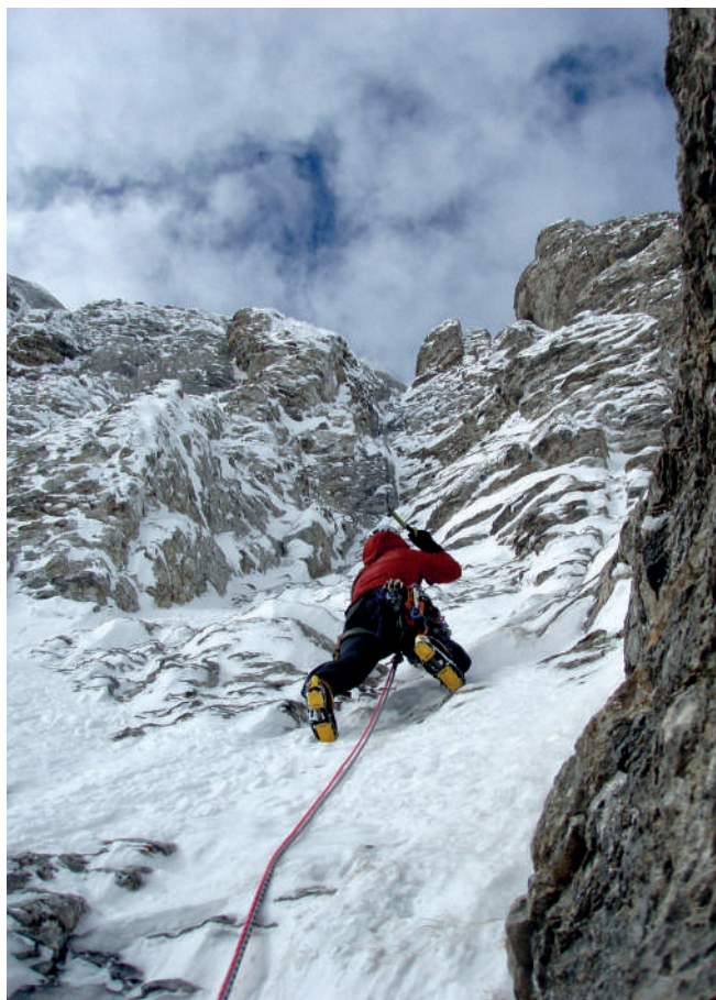
Χειμερινή αναρρίχηση στο Θρόνο του Δία.

Δεξιά: Βγαίνοντας από το Λαιμό και πλησιάζοντας προς το Οροπέδιο των Μουσών