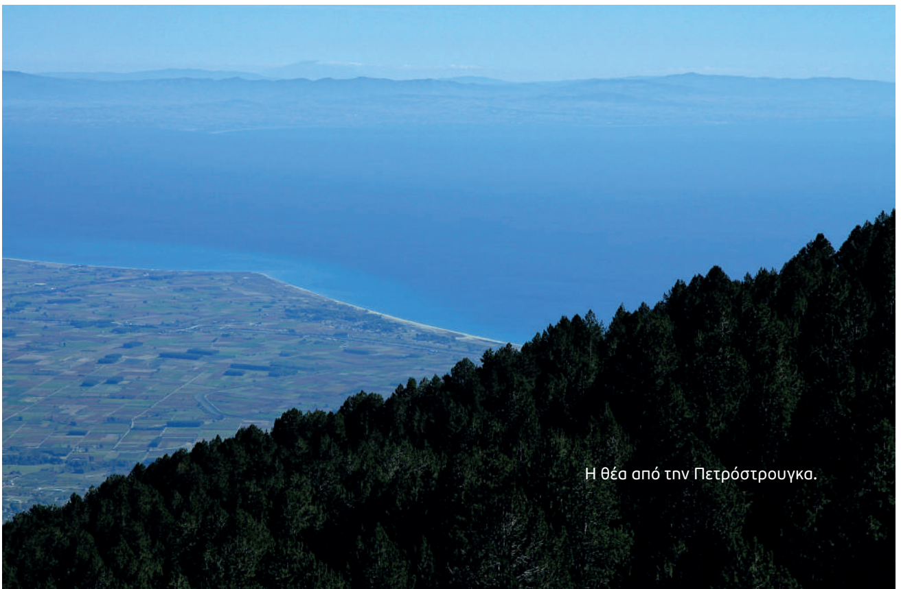
Η θέα από την Πετρόστρουγκα.

-Τώρα πια, με το Καταφύγιο της Πετρόστρουγκας σε λειτουργία, ελάχιστα διαφέρει.